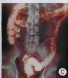
COSA SI VEDE DALLE RADIOGRAFIE Nelle immagini qui a lato: A: così appare l'intestino sano; B: le lesioni causate dalla colite ulcerosa; C: l'ispessimento delle pareti intestinali dovuto al morbo di Crohn.